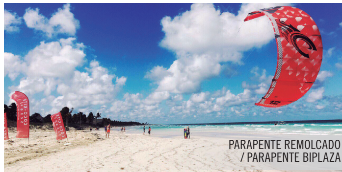
PARAPENTE REMOLCADO / PARAPENTE BIPLAZA